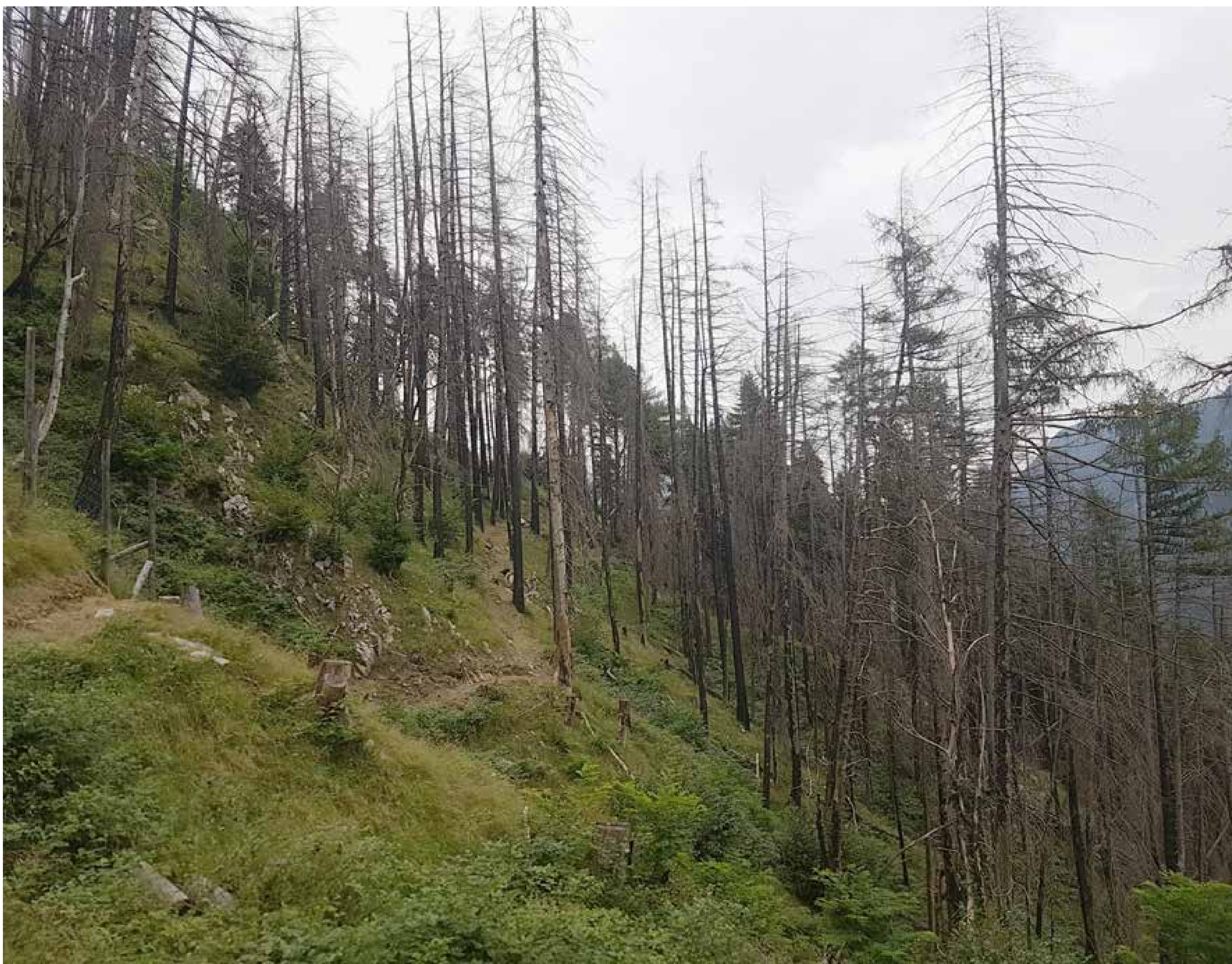
Forstwirtschaftliche Eingriffe nach Brand, Osco TI