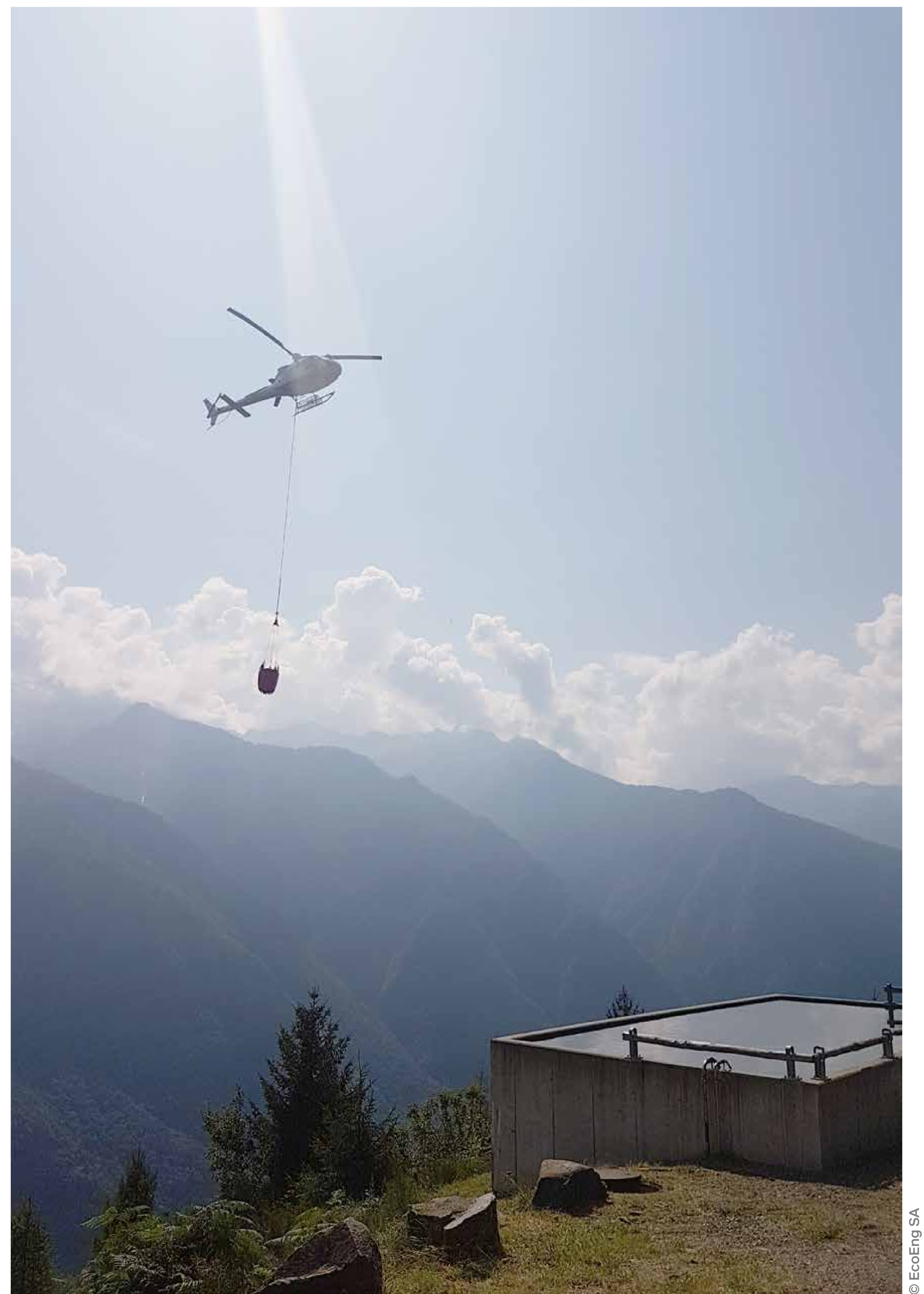
Versorgungsbecken für Helikopter, Santa Maria GR