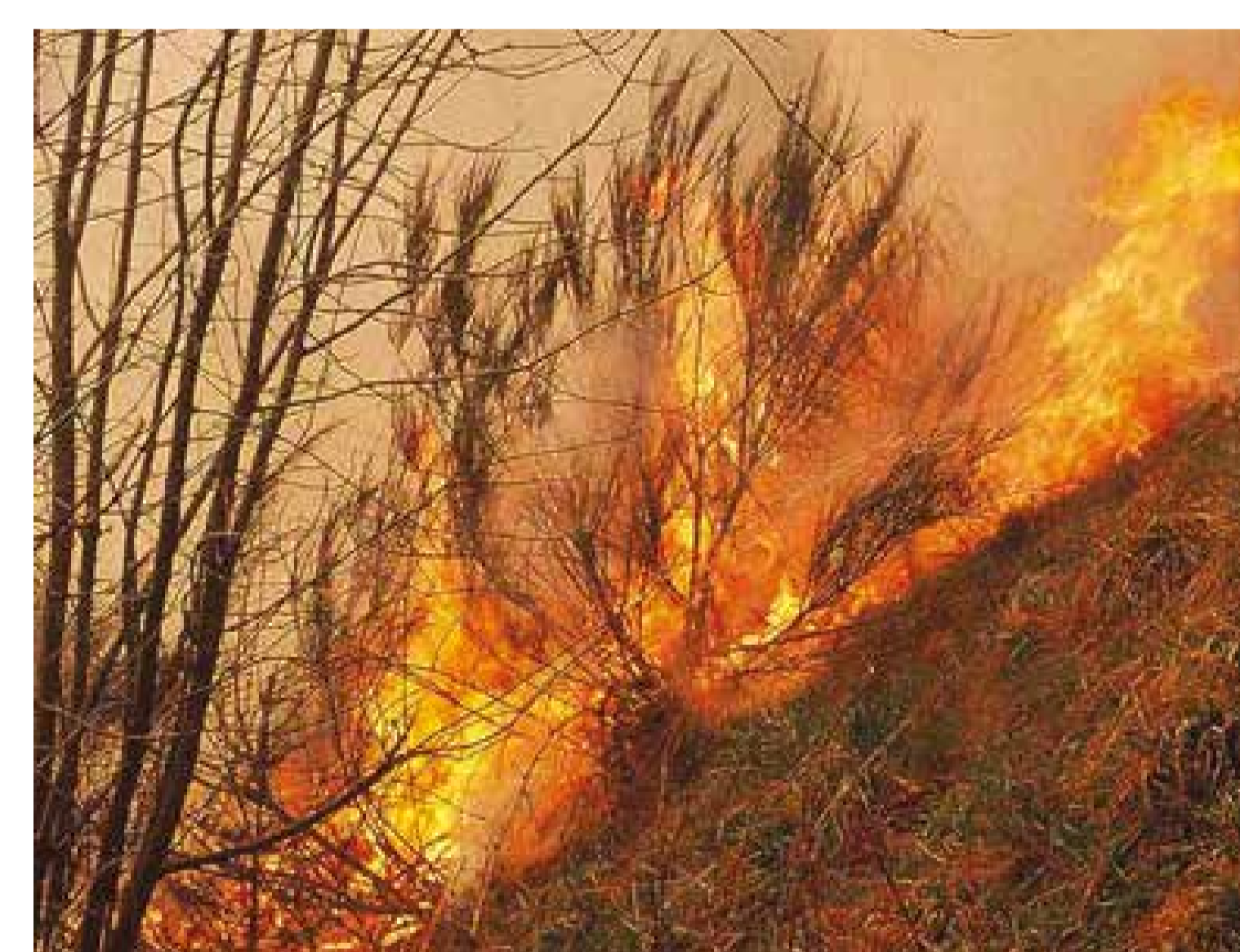
Bodenbrand mit hoher Intensität