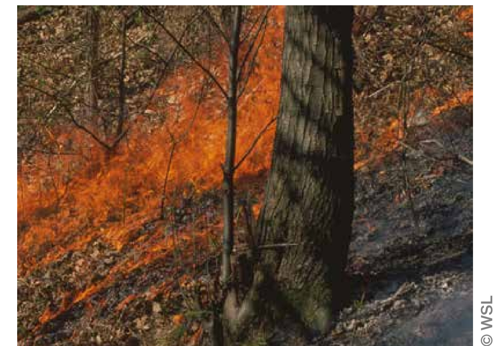
Bodenbrand mit geringer Intensität